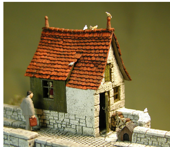
Inkl. Hund mit Hütte, Holzstoss und Kassierer