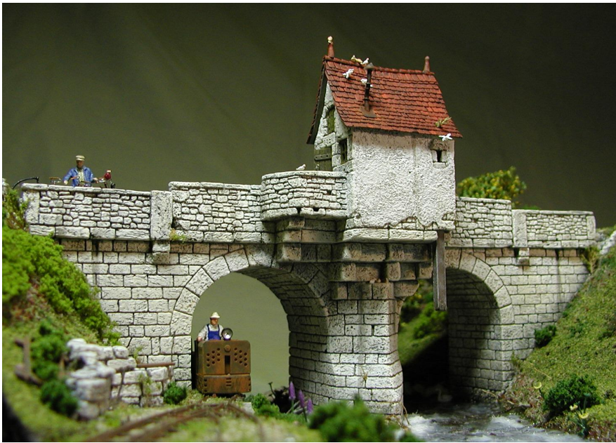
"Bergseite" - Haus mit Abtrittrohr