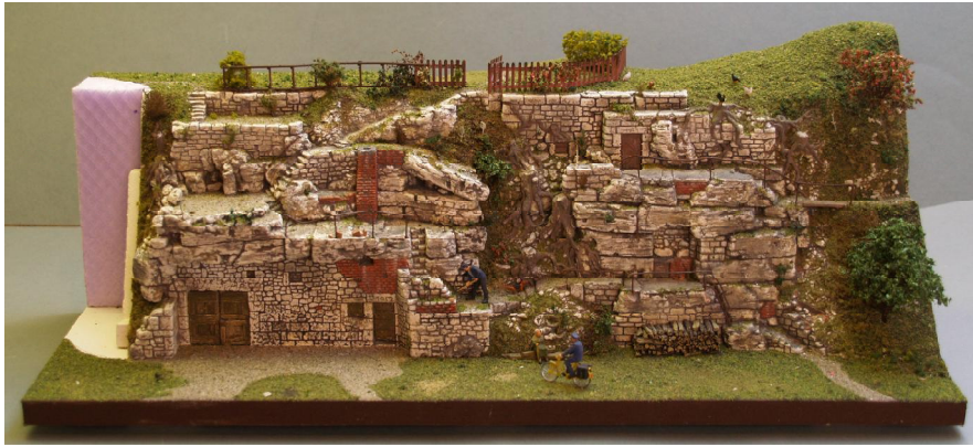
Gestaltungbeispiel Hang 1 und 2 zusammengebaut

Verschiedene thematische Steilhänge mit 60° Schräge. Untereinander teilweise kombinierbar. Montage auf mitgelieferten Keilen. Superfeine Details wie: Baumstumpf, Ziegel- und Steinmauern, realistische Felsen- und Holzoberflächen, etc.