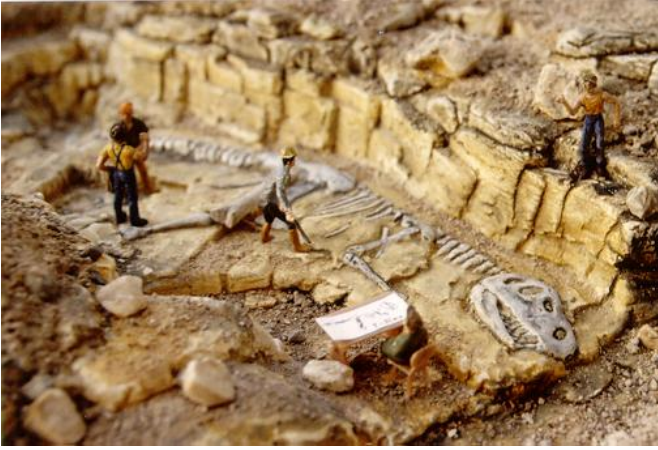
Saurierabguß eingebaut in ein Diorama - H0.

Auf Dinosaurier stieß man erst spät in der Geschichte der Fossilienforschung. Das war gegen Anfang des 18. Jhds.